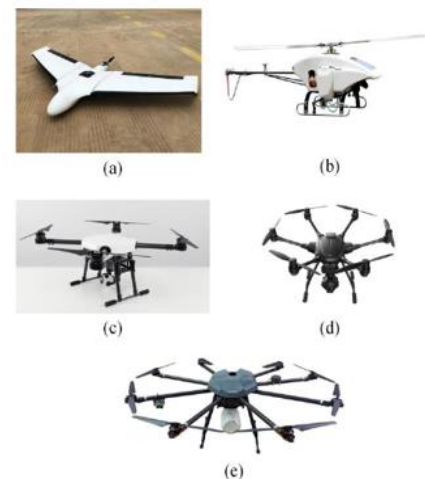
a) Ailes fixes, b) monomoteur, c) quadricoptère, d) hexacoptère, e) octocoptère (Source 3)

Un multi-rotor peut être divisé en un seul rotor, un quadricoptère, un hexacoptère et un octocoptère. Comparé au drone à voilure fixe, un multi-rotor a une vitesse, une distance et une durée de vol inférieures car il a besoin d'une énorme quantité de puissance pour générer de la portance et rester en l'air.